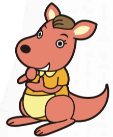
第一工場キャラクター おかあさん