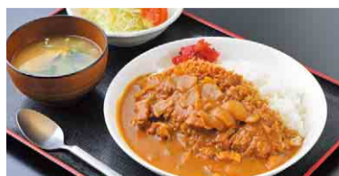
やまと カツカレー 950円(税込) 住所: 松伏町松伏 2039-1 ☎992-0077