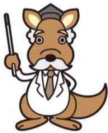
第一工場キャラクター かんきょう博士