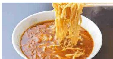
珍来 松伏店 カレーラーメン 720円(税込) 住所: 松伏町松伏 2862 ☎992-4726