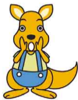
第一工場キャラクター かんちゃん