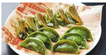
満てん餃子 カレーチーズ餃子 (12個・冷凍販売のみ) 780円(税込) 住所: 松伏町上赤岩 812 ☎080-3523-9603