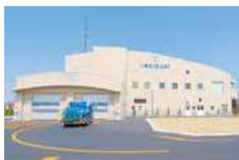
第二工場汚泥再生処理センター