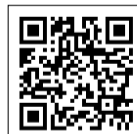
「三郷市観光協会」ホームページ

『みさと友歩道』は、二郷半用水の遊歩道にある果実をイメージしたりんご・青梅・小倉の3種類の餡をパイ生地 あん で包んだサクツとした食感のお菓子です。