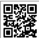
「こしがや愛されグルメ」ホームページ

「大相模不動尊大聖寺」は、天平勝宝2年(750年)の創建と言われる古刹で、越谷最古の寺院と伝えられています。山門に掲げられている「真大山」の額は老中松平定信の筆によるものです。その境内で販売され、長く参拝者に愛されているのが『虹だんご』。うるち米を使用し、かむほどに米のうまみが広がるこだわりのだんごは、『こしがや愛されグルメ』認証品です。