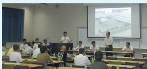
建設工事説明会の様子(第二工場大会議室)