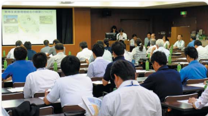
「事業系廃棄物適正処理等に係る説明会」

説明会終了後のアンケートには、「(中略)排出者(市民、企業)にも啓発活動をしていただきたい。多量のごみを出す事業所や袋の中に詰められた物などは、収集時になかなか取り出せなく、わからないことがあります。」(搬入事業者)という意見がありました。