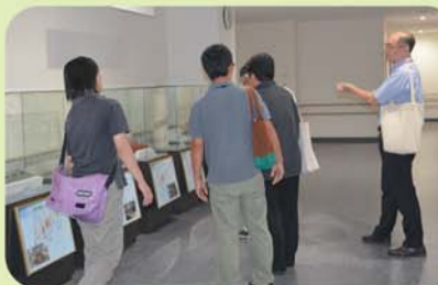
第二工場ごみ処理施設見学

また、組合が行っている周辺地元・環境への配慮についての考え方は、学校運営にもつながるとの意見もありました。