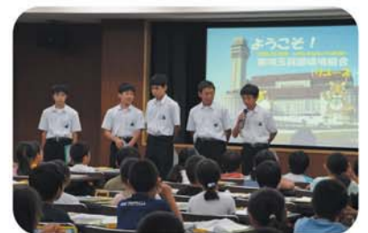
小学生の前であいさつをする中学生