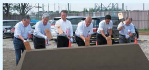
安全祈願祭 鍬入れの儀(管理者及び理事)

第二工場し尿処理施設の更新整備として、新たに(仮称)汚泥再生処理センターの建設工事を進めています。