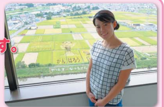
星選手をモチーフとした田んぼアートとともに

9月15日に、リオデジャネイロ・オリンピック、水泳で銅メダルを獲得した星奈津美選手が展望台から田んぼアートを鑑賞しました。