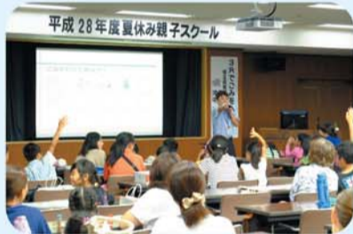
埼玉県職員による講座