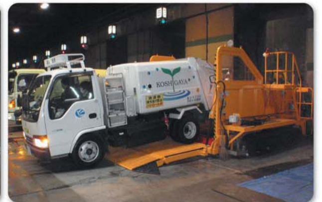
ごみ投入検査機にごみを出す収集車