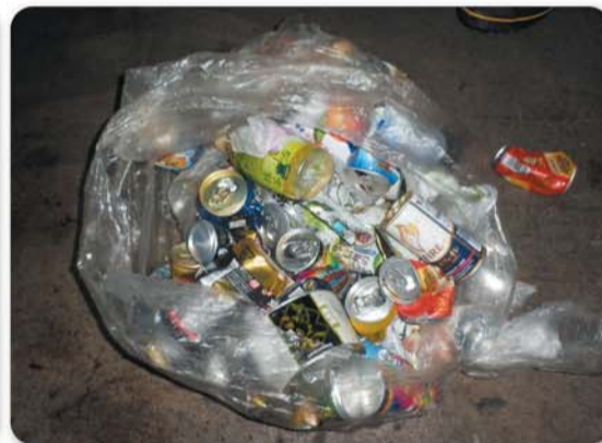
搬入された不燃ごみ(可燃ごみしか搬入できません)