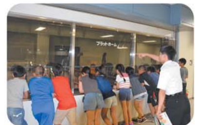
中学生による工場見学案内(第一工場6階プラットフォームにて)

また、桜井南小学校は、中学生(5人中4人)の母校であり、引率された先生は、成長した教え子へ嬉しそうに声をかける場面も見受けられました。